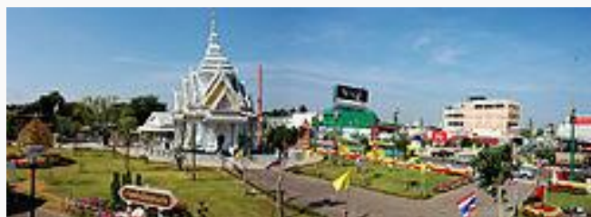
ศาลหลักเมือง