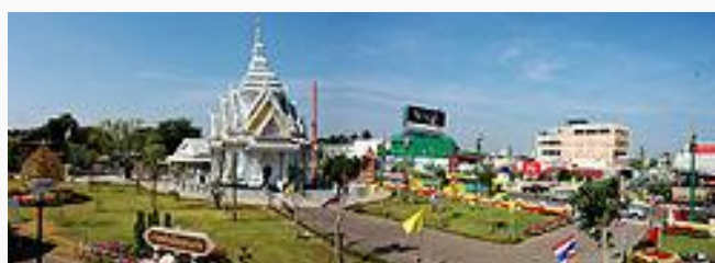
ศาลหลักเมือง