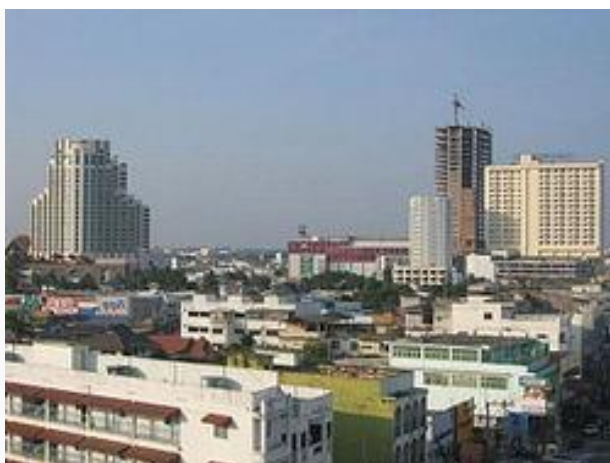
เทศบาลนครขอนแก่น